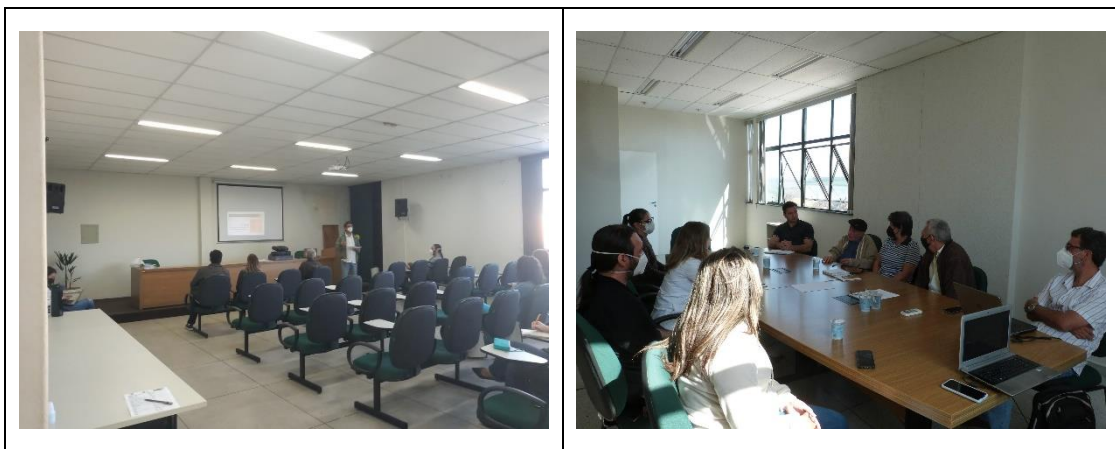
Figura 7. Reuniões junto ao Conselho Consultivo para apresentação e apreciação da proposta de zoneamento do Parque Natural Municipal Olésio dos Santos, município de Salto de Pirapora, estado de São Paulo.

Após uma discussão sobre o conteúdo do documento, os conselheiros receberam uma versão impressa para um melhor aprofundamento do assunto, com a finalidade de realizar uma nova reunião sobre o tema. No dia 18/07/2022, foi retomada a reunião do conselho, na qual foi discutido o conteúdo da proposta de zoneamento da Unidade de Conservação. Nesta mesma reunião, a Secretaria de Meio Ambiente decidiu aprovar o documento de forma condicionada a realização da oficina participativa com a sociedade, na qual seriam coletadas possíveis informações complementares para o zoneamento ( Figura 7 ). Como descrito na primeira parte deste documento, houve um bom alinhamento entre as contribuições da comunidade com a proposta de zoneamento, a qual foi revisada e adequada quando necessário, sendo então encaminhada pela equipe técnica da UFSCar para a Secretaria de Meio Ambiente de Salto de Pirapora, no dia 19/08/2022 para os trâmites visando a conclusão desta etapa de trabalho.