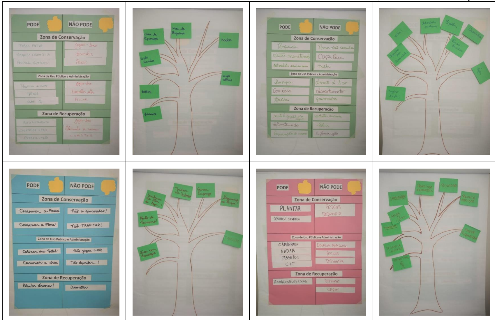
Figura 4. Produtos elaborados pelos grupos de trabalho para discussão sobre a proposta de zoneamento do Parque Natural Municipal Olésio dos Santos, município de Salto de Pirapora, estado de São Paulo.