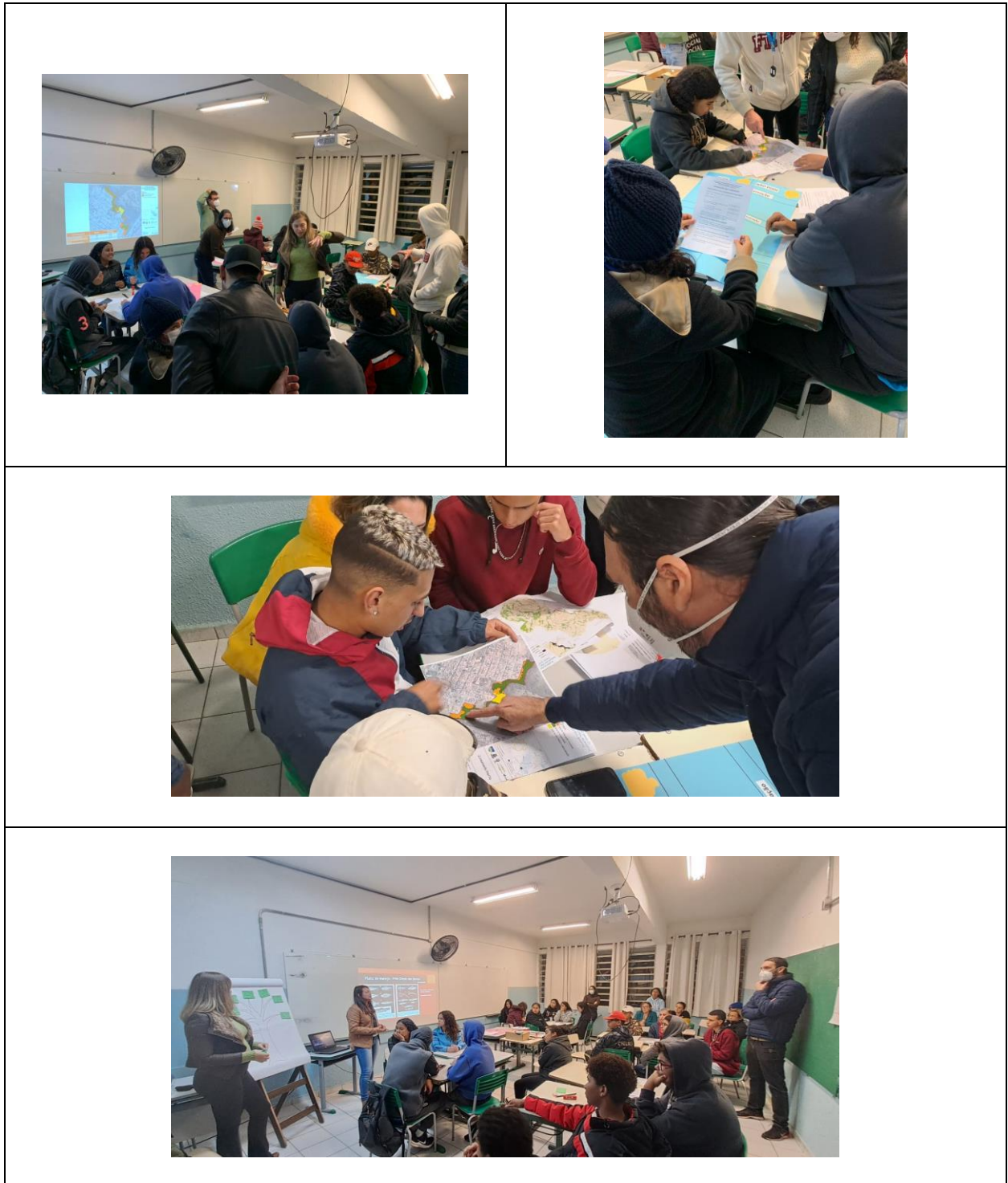
Figura 3. Oficina de zoneamento do Parque Natural Municipal Olésio dos Santos, município de Salto de Pirapora, estado de São Paulo.