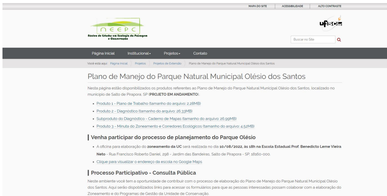
Figura 5. Página institucional para a disponibilização dos produtos desenvolvidos pelo Núcleo de Estudos em Ecologia da Paisagem e Conservação da Universidade Federal de São Carlos, Campus Sorocaba (NEEPC - UFSCar), para a elaboração do Plano de Manejo do Parque Natural Municipal Olésio dos Santos, município de Salto de Pirapora, estado de São Paulo.